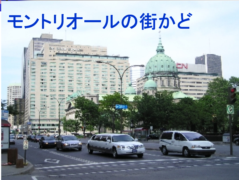
モントリオールの街かど