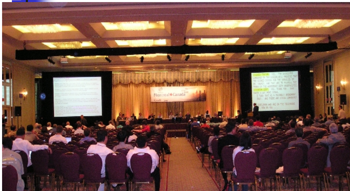
大スクリーンに 速記表示