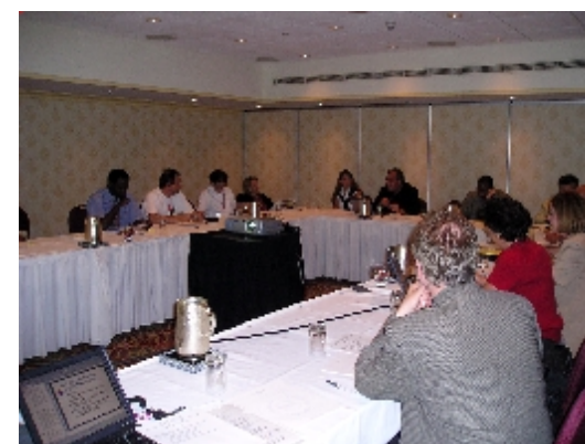
カナダのユーザーと ALACの会議